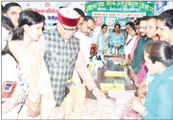
पुष्कर सिंह धामी सरकार द्वारा समान नागरिक संहिता सहित कई जनहितकारी निर्णयों का उल्लेख करते हुए

छह किसानों को 5-5 लाख रुपये के चेक, दो महिलाओं को महालक्ष्मी किट वितरित