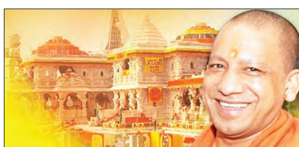
विकास परियोजनाओं पर निर्माण कार्य प्रारम्भ कराया जा रहा है, जिन

टीम एक्शन इंडिया लखनऊ: मुख्यमंत्री योगी आदित्यनाथ के नेतृत्व में उत्तर प्रदेश सरकार प्रदेश के धार्मिक, सांस्कृतिक और पर्यटन स्थलों को विश्वस्तरीय सुविधाओं से जोड़ने की दिशा में लगातार आगे बढ़ रही है। इसी क्रम में पर्यटन विभाग ने 31 मार्च 2026 तक स्वीकृत परियोजनाओं पर तेजी से कार्रवाई शुरू कर दी है। प्रदेश के 8 जिलों में 33 पर्यटन एवं धार्मिक