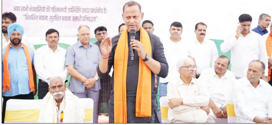
उठाया गया। इस अवसर पर उपस्थित जनसमूह को संबोधित करते हुए रविन्द्र इन्द्राज सिंह ने कहा कि दीप विहार बवना विधानसभा का अत्यंत महत्वपूर्ण हिस्सा है तथा यहां के निवासियों

तीर्थ राज/एक्शन इंडिया नई दिल्ली: बवना विधानसभा क्षेत्र के दीप विहार में शनिवार को दिल्ली सरकार के समाज कल्याण मंत्री एवं बवना विधानसभा क्षेत्र से विधायक रविन्द्र इन्द्राज सिंह ने शहरी विकास निधि के अंतर्गत लगभग 20 करोड़ की लागत से विभिन्न विकास परियोजनाओं का शुभारंभ किया। इस अवसर पर क्षेत्र में सड़कों एवं नालियों के निर्माण कार्यों को शुरुआत की गई, जिससे दीप विहार सहित आसपास के क्षेत्रों में आधारभूत सुविधाओं को सुदृढ़ करने की दिशा में एक महत्वपूर्ण कदम