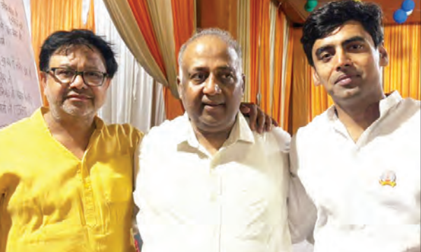
श्रद्धालुओं ने भक्ति रस का पान करते हुए धर्म लाभ उठाया। आध्यात्मिक चेतना जगाना ही मुख्य उद्देश्य: समिति कार्यक्रम की सफलता पर खुशी जताते हुए श्री आदर्श कला केंद्र के पदाधिकारियों ने कहा कि पुरुषोत्तम मास (अधिकमास) सनातन धर्म में आध्यात्मिक साधना, विशेष भक्ति और पुण्य अर्जित करने का सर्वोत्तम अवसर माना जाता है। इसी पवित्र उद्देश्य