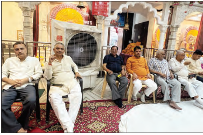
और प्रभु के प्रति अटूट प्रेम का अनूठा प्रतीक है। जब भक्त के मन में केवट जैसा निश्चल प्रेम होता है, तो साक्षात् ईश्वर भी उसकी नाव पर सवार होने को विवश हो जाते हैं। जय श्रीराम के जयकारों से गुंजायमान हुआ