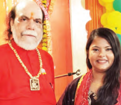
देकर उपस्थित जनसैलाब को मंत्रमुग्ध कर दिया। गायिका की सुरीली आवाज और भक्ति गीतों की धुनों पर श्रद्धालु खुद को रोक नहीं पाए और अपने स्थान पर खड़े होकर झूमने लगे। पूरे कार्यक्रम के दौरान पंडाल भगवान के जयकारों से गुंजायमान रहा, जिससे पूरा वातावरण पूरी तरह आध्यात्मिक हो गया। हर वर्ग में दिखा भारी उत्साह इस आयोजन की खास बात यह रही कि इसमें महिलाओं, युवाओं और बुजुर्गों सहित समाज के सभी वर्गों के लोगों ने बढ़-चढ़कर और बेहद उत्साहपूर्वक भाग लिया। नहे-मुन्ने बच्चे भी भगवान के भजनों पर धिरकते नजर आए।