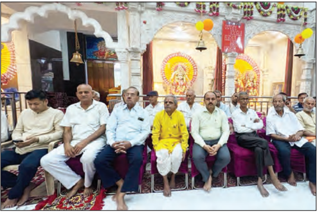
मंदिर परिसर: कथा के दौरान भजनों की सुमधुर प्रस्तुतियों पर श्रद्धालु भक्ति रस में सराबोर नजर आए। जैसे ही केवट द्वारा भगवान के चरण पखारने (धोने) का प्रसंग आया, पूरा मंदिर परिसर 'जय श्रीराम' और 'सिववर रामचंद्र की