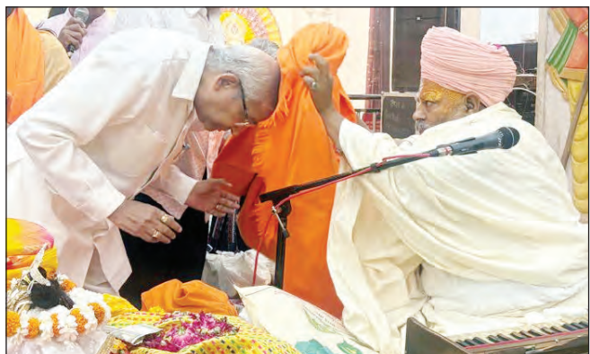
मार्गदर्शिका है। राम विवाह केवल दो आत्माओं का मिलन नहीं, बल्कि धर्म, मर्यादा और संस्कारों का संगम है। आज के समाज को टूटने से बचाने के लिए हमें रामायण में निहित पारिवारिक आदर्शों और आपसी सम्मान को अपने जीवन में उतारना होगा। कथा के दौरान भजनों पर झूमते श्रद्धालुओं ने