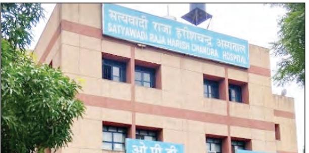
इलाज करवाने आए एक तीमारदार ने बताया कि हम सुबह 5 बजे ही अस्पताल आ गए थे, लेकिन 6 घंटे बीत जाने के बाद भी डॉक्टर का कुछ पता नहीं चला। हमें भारी परेशानी का सामना करना पड़ रहा है। प्राइवेट जाने की मजबूरी: जागृति एन्क्लेव से आए एक बुजुर्ग मरीज ने अपनी आंखों की समस्या साझा

नई दिल्ली: नरेला स्थित सत्यवादी राजा हरिश्चंद्र अस्पताल काफी लंबे समय से बदहाली के दौर से गुजर रहा है। अस्पताल में न तो डॉक्टरों की पर्याप्त संख्या है और न ही टेस्ट की पूरी सुविधा। स्थिति यह है कि जो टेस्ट होते भी हैं, उनके उपकरणों की भारी कमी बनी हुई है। इस अवस्था के कारण दूर-दराज से आने वाले गरीब मरीज दर-दर भटकने को मजबूर हैं। भगवान भरोसे हरिश्चंद्र हॉस्पिटल अस्पताल की ओपीडी में सुबह से ही मरीजों और उनके परिजनों की लंबी कतारें लग जाती हैं, लेकिन डॉक्टरों के कैंबिन खाली मिलते हैं। 6 घंटे बाद भी नहीं मिले डॉक्टर: सिंधु से अपने भतीजे का