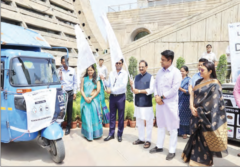
एनडीएमसी ने किआ इंडिया और आईपीसीए के सहयोग से ह्यप्रोजेक्ट डीआरओपी का किया शुभारंभ।

साहस और लोगों के प्रति स्नेह उन्हें सबसे अलग बनाता था। उन्होंने कहा कि दिल्ली सरकार की यह पहल बेहद सराहनीय है। अब यह हम सभी नागरिकों, प्रशासन और परिवार की सामूहिक जिम्मेदारी है कि इस चौक को दिल्ली के सबसे स्वच्छ, सुंदर और सुव्यवस्थित सार्वजनिक स्थलों में शामिल किया जाए ताकि उनके नाम का सम्मान संदेव बना रहे। मुख्यमंत्री ने कहा कि पत्रकारिता, सार्वजनिक जीवन और समाज सेवा के क्षेत्र में अश्विनी कुमार चोपड़ा का कार्य आने वाली पीढ़ियों के लिए हमेशा प्रेरणा का स्रोत रहेगा। उन्होंने कहा कि उन्होंने (मिन्ना) एक निर्भीक पत्रकार के रूप में अपनी लेखनी के माध्यम से हमेशा समाज की आवाज को बुलंद किया। इस महत्वपूर्ण चौक का नामकरण केवल एक औपचारिकता नहीं बल्कि उनके व्यक्तित्व और देश के प्रति योगदान को समाज की ओर से दी गई एक सच्ची श्रद्धांजलि है। उल्लेखनीय है कि दिवांगत अश्विनी कुमार चोपड़ा (मिन्ना) करनाल से भारतीय जनता पार्टी (भाजपा) के पूर्व सांसद एवं वरिष्ठ पत्रकार थे।