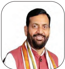
नायब सिंह सैनी, मुख्यमंत्री हरियाणा

“आज विश्व मंच पर भारत की भूमिका भी पहले से कहीं अधिक प्रभावशाली और निर्णायक है। एक समय था जब भारत वैश्विक घटनाओं का पर्यवेक्षक माना जाता था। लेकिन, आज भारत वैश्विक विमर्श का नेतृत्व कर रहा है। जी-20 की सफल अध्यक्षता, एक पृथ्वी, एक परिवार, एक भविष्य का संदेश, ग्लोबल साउथ की आवाज को विश्व संतुलित विदेश नीति के माध्यम से विभिन्न वैश्विक शक्तियों के साथ मजबूत संबंध बनाना माननीय प्रधानमंत्री जी की वैश्विक कूटनीति और भारत की बढ़ती वैश्विक प्रतिष्ठा का प्रमाण है।”