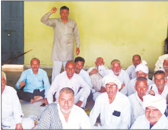
रखीं। बैठक में किसानों ने

अगवानपुर रेलवे फाटक पर निर्माणधीन अंडरपास का कार्य जल्द पूरा कराने की मांग उठाई