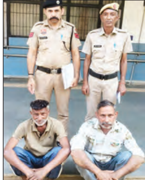
सफलतापूर्वक गिरफ्तार कर