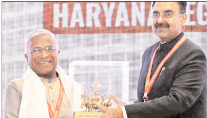
कल्याण, उपाध्यक्ष डॉ कृष्ण मिश्रा सहित कई राज्यों के अध्यक्ष, उपाध्यक्ष,

टीम एक्शन इंडिया चंडीगढ़: राज्य सभा के उप सभापति हरिवंश ने कहा कि समाज, शासन और जनप्रतिनिधियों के बीच संवाद शक्ति का बेहतर स्रोत होता है। जिसके परामर्श से जनहितकारी कार्यों को अमलीजामा पहनाया जा सकता है। वर्तमान समय के दौर में परामर्श होना बहुत ही जरूरी है। उन्होंने कहा कि शिक्षा की ताकत से ही देश का नया इतिहास लिखा जा सकता है। उप सभापति हरियाणा विधानसभा द्वारा आयोजित सीपीए इंडिया रीजन गॉथ जोन - 11 कॉन्फ्रेंस के दूसरे सत्र को संबोधित कर रहे थे। इस दो दिवसीय कॉन्फ्रेंस में हरियाणा विधानसभा अध्यक्ष हरचिन्द्र