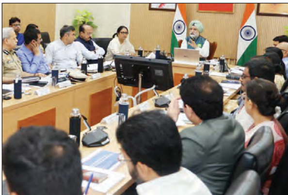
स्थिति की भी समीक्षा की गई। उपराज्यपाल तरनजीत सिंह

टीम एक्शन इंडिया नई दिल्ली: दिल्ली के उपराज्यपाल तरनजीत सिंह संधू ने सोमवार को मुख्यमंत्री रेखा गुप्ता के साथ दिल्ली आपदा प्रबंधन प्राधिकरण (डीडीएमए) की बैठक की अध्यक्षता की। इस बैठक में दिल्ली में विभिन्न विकास पहलों, शासन प्राथमिकताओं और जन कल्याण से संबंधित मामलों पर चर्चा की गई। साथ ही बैठक में गर्मी से संबंधित आपदा प्रबंधन उपायों और मानसून की तैयारियों को