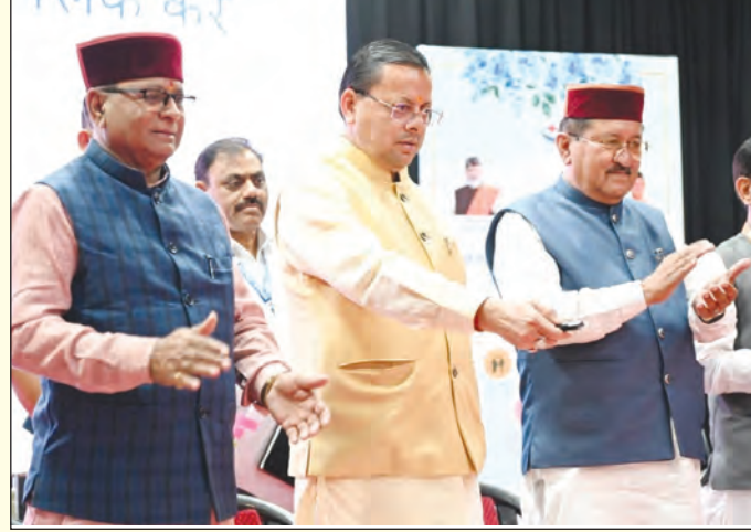
सामाजिक न्याय को मजबूत बनाने के लिए लगातार कार्य कर रही है।

सामाजिक कल्याण योजनाओं को समाज के अंतिम व्यक्ति तक पहुंचाना सरकार की सर्वोच्च प्राथमिकता है और प्रत्येक पात्र व्यक्ति को बिना किसी भेदभाव व देरी के योजनाओं का लाभ मिलना चाहिए। मुख्यमंत्री ने कहा कि प्रधानमंत्री नरेन्द्र मोदी के नेतृत्व में जन-धन योजना, उज्वला योजना, प्रधानमंत्री आवास योजना, आयुष्मान भारत और मुफ्त राशन जैसी योजनाओं ने करोड़ों लोगों के जीवन में सकारात्मक बदलाव लाया है। वहीं मुद्रा योजना, पीएम स्वनिधि, स्टैंड-अप इंडिया और राष्ट्रीय आजीविका मिशन जैसी योजनाओं ने स्वरोजगार और आर्थिक सशक्तिकरण को बढ़ावा दिया है। उन्होंने कहा कि राज्य सरकार