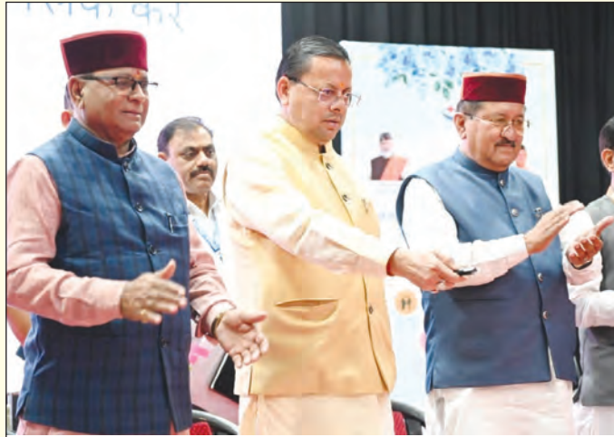
सामाजिक न्याय को मजबूत बनाने के लिए लगातार कार्य कर रही है।

सामाजिक कल्याण योजनाओं को समाज के अंतिम व्यक्ति तक पहुंचाना सरकार की सर्वोच्च प्राथमिकता है और प्रत्येक पात्र व्यक्ति को बिना किसी भेदभाव व देरी के योजनाओं का लाभ मिलना चाहिए। मुख्यमंत्री ने कहा कि प्रधानमंत्री नरेन्द्र मोदी के नेतृत्व में जन-धन योजना, उज्वला योजना, प्रधानमंत्री आवास योजना, आयुष्मान भारत और मुफ्त राशन जैसी योजनाओं ने करोड़ों लोगों के जीवन में सकारात्मक बदलाव लाया है। वहीं मुद्रा योजना, पीएम स्वनिधि, स्टैंड-अप इंडिया और राष्ट्रीय आजीविका मिशन जैसी योजनाओं ने स्वरोजगार और आर्थिक सशक्तिकरण को बढ़ावा दिया है। उन्होंने कहा कि राज्य सरकार