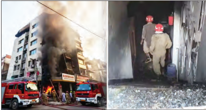
है और चिकित्सा उपचार के लिए पास के अस्पतालों में भर्ती कराया गया है। अधिकारियों ने बताया कि अभी तक

सूचना मिलते ही अग्निशमन विभाग, दिल्ली पुलिस और आपदा प्रबंधन एजेंसियों की टोमें मौके पर पहुंची और बड़े स्तर पर राहत एवं बचाव अभियान शुरू किया। आधिकारिक जानकारी के अनुसार इस दुखद घटना में 21 लोगों को मृत घोषित कर दिया गया है। 8 दमकल गाड़ियों की सहायता से आग को सफलतापूर्वक बुझा दिया गया है। पुलिस, अग्निशमन सेवाओं और अन्य आपातकालीन बचाव कर्मियों के समन्वित प्रयासों से, 40 से अधिक लोगों को सुरक्षित बाहर निकाला गया है और चिकित्सा उपचार के लिए पास के अस्पतालों में भर्ती कराया गया है। अधिकारियों ने बताया कि अभी तक