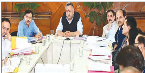
समाहित डिग्री कार्यक्रम प्रारम्भ करने जा रही है। इस पहल के तहत विद्यार्थियों को विभिन्न उद्योगों के साथ कार्य करने का अवसर मिलेगा तथा उन्हें स्टाइपेंड भी प्रदान किया जाएगा। इससे उनके कौशल विकास के साथ-साथ