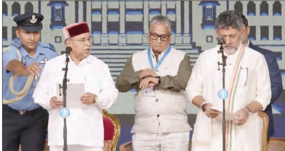
कर्नाटक की राजनीति में बुधवार को एक नए अध्याय की शुरुआत हुई, जब कांग्रेस के वरिष्ठ नेता डी.के. शिवकुमार ने राज्य के 25वें मुख्यमंत्री के रूप में पद एवं गोपनीयता की शपथ ग्रहण की।

गया था, जिसके लिए मुख्यमंत्री को धन्यवाद दिया। कोलकाता, हावड़ा और उत्तर 24 परगना के विपक्षी विधायक बैठक में शामिल हुए और विपक्ष सरकार के सकारात्मक कदमों का समर्थन करने के साथ-साथ जनहित के मुद्दों पर सशक्त तरीके से आवाज उठाएगा।