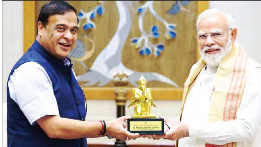
असम के मुख्यमंत्री हिमंत बिस्व सरमा ने प्रधानमंत्री मोदी से की मुलाकात।

बसे अवैध घुसपैटियों की पहचान और उन्हें वापस भेजने की प्रक्रिया को सुनिश्चित करना चाहिए। साथ ही प्रत्येक सीमावर्ती जिले की विशेष चुनौतियों को ध्यान में रखते हुए स्थानीय प्रशासन को मानक संचालन प्रक्रिया (एसओपी) तैयार करनी चाहिए।