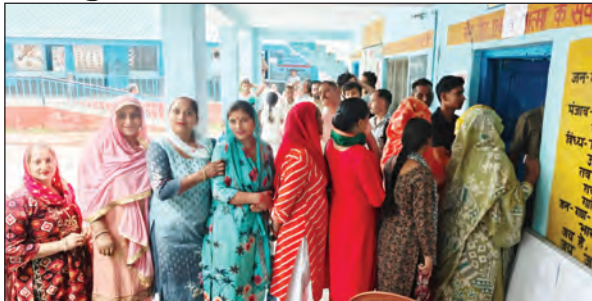
मतदान हुआ था, जबकि पिछले पंचायत चुनाव में कुल मतदान करीब 78 प्रतिशत रहा था। सुबह से ही प्रदेश के कई हिस्सों में बादल छाए रहे और शिमला, सोलन, कुल्लू सहित कई जिलों में

टीम एक्सन इंडिया शिमला। हिमाचल प्रदेश में पंचायती राज संस्थाओं के चुनाव के तीसरे और अंतिम चरण में शनिवार को मतदाताओं ने उत्साह का नया रिकॉर्ड कायम कर दिया। खराब मौसम, कई इलाकों में बारिश और तेज हवाओं के बावजूद मतदाता बड़ी संख्या में मतदान केंद्रों तक पहुंचे। राज्य की 1189 ग्राम पंचायतों में हुए मतदान में कुल 80.41 प्रतिशत मतदान दर्ज किया गया, जो पहले दो चरणों और पिछले पंचायत चुनाव की तुलना में अधिक रहा। पहले चरण में लगभग 79 प्रतिशत और दूसरे चरण में करीब 80 प्रतिशत