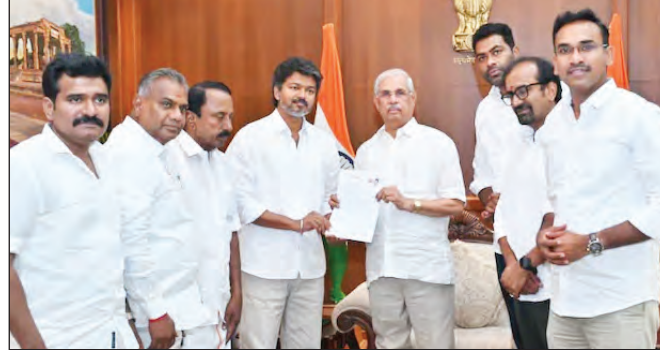
कांग्रेस के समर्थन के बाद विजय की पार्टी टीवीके के गठबंधन की संख्या

हुई है। वहीं, राज्यपाल अभी तक टीवीके के दावे से पूरी तरह संतुष्ट नहीं हैं क्योंकि पार्टी के पास बहुमत साबित करने के लिए पर्याप्त आधिकारिक आंकड़े नहीं हैं। ऐसे समझौते बहुमत का गणित तमिलनाडु की 234 सदस्यीय विधानसभा में सरकार बनाने के लिए 118 सीटों की जरूरत होती है। इस चुनाव में विजय की पार्टी टीवीके ने 108 सीटों पर जीत दर्ज की है। कांग्रेस पार्टी ने टीवीके को अपना समर्थन देने का एलान किया है। कांग्रेस के पास विधानसभा में 5 सीटें हैं।