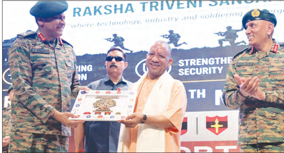
यूपी के मुख्यमंत्री योगी आदित्यनाथ जनपद प्रयागराज में 'रक्षा त्रिवेणी संगम' की थीम पर नॉर्थ टैक सिम्पोजियम (एनटीएस) 2026 का समापन समारोह में शामिल होते हुए।

लिए एक ढांचा स्थापित करना है, जिसमें फार्मास्यूटिकल्स, जैविक उत्पाद, चिकित्सा उपकरण और सौरयंत्र प्रशासन शामिल हैं। डिजिटल टेक्नोलॉजी और आईटी क्षेत्र में भी दोनों देशों ने साझेदारी मजबूत करने का फैसला किया है।