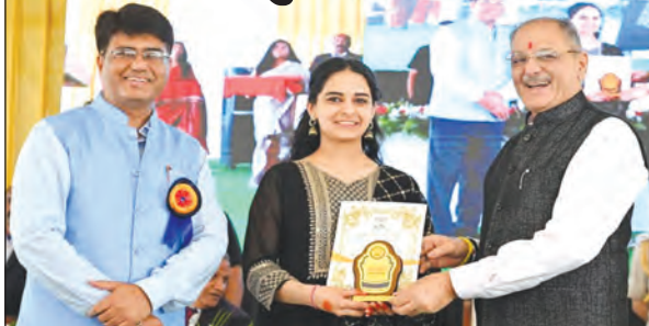
राज्यपाल ने कहा कि हिमाचल डेंटल कॉलेज, सुंदरनगर प्रदेश का अग्रणी दंत चिकित्सा संस्थान है, जिससे शिक्षा, शोध, सामुदायिक सेवा और स्वास्थ्य जागरूकता के क्षेत्र में उल्लेखनीय योगदान दिया है। उन्होंने कहा कि दंत स्वास्थ्य