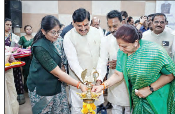
चलकर जिला स्तर तक काम करेगा। केला किसानों के लिए विशेष योजना और औद्योगिक विस्तार

टीम एक्शन इंडिया बुरहानपुर/भोपाल। मध्य प्रदेश के मुख्यमंत्री डॉ. मोहन यादव बुधवार को बुरहानपुर के एक दिवसीय दौरे पहुंचे। यहां उन्होंने न केवल 'उद्यमी संवाद' कार्यक्रम में विचार साझा किए, बल्कि राजनीतिक मंच से विपक्ष पर भी तीखे प्रहार भी किए। मुख्यमंत्री डॉ. यादव ने परमानंद गोविंदजीवाला ऑडिटोरियम में आयोजित 'उद्यमी संवाद' कार्यक्रम में उद्योगपतियों से संवाद के दौरान निमाड़ क्षेत्र में 'इन्वेस्टर्स समिट' आयोजित करने की घोषणा की। इसके उपरांत, भाजपा के 'विजय उत्सव' में शामिल होकर उन्होंने मंच पर