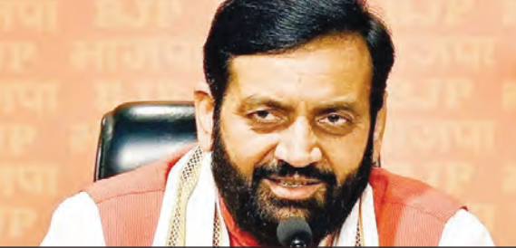
नाथ सिंह सैनी बुधवार को हरियाणा सिविल सचिवालय में विभिन्न विभागों के अधिकारियों के साथ प्रदेश में अनाज भंडारण

चंडीगढ़। हरियाणा के मुख्यमंत्री नाथ सिंह सैनी ने कहा कि अनाज को खराब होने से बचाने के लिए जरूरी है कि प्रदेश में पर्याप्त संख्या में वेयरहाउस व साइलो उपलब्ध हों। इसके लिए संबंधित विभाग विस्तृत कार्ययोजना बनाकर जल्द से जल्द अनाज भंडारण की समस्या का स्थाई समाधान निकालें। उन्होंने निर्देश दिए कि अनाज भंडारण के लिए शाहबाद व अंबाला के बीच साइलो बनाने की योजना तैयार की जाए।