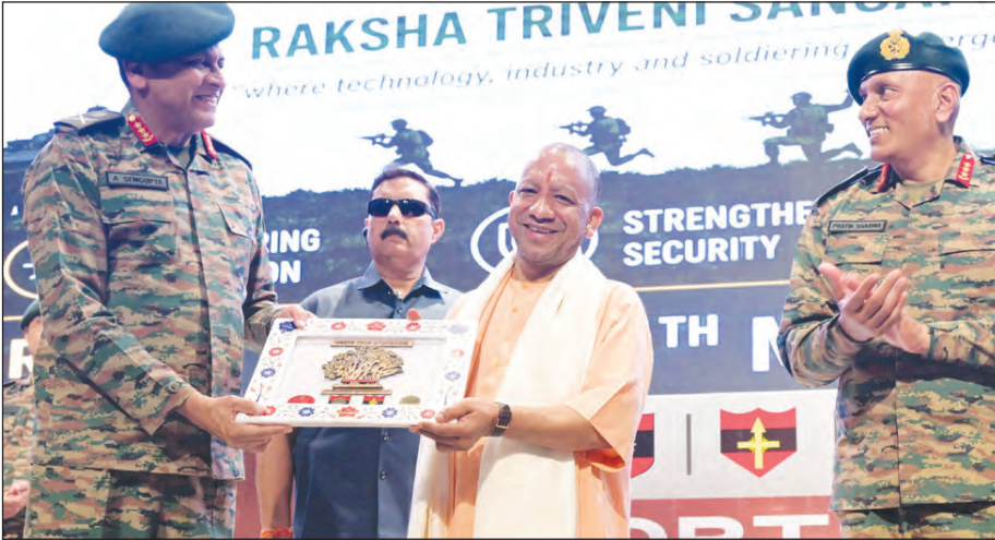
यूपी के मुख्यमंत्री योगी आदित्यनाथ जनपद प्रयागराज में 'रक्षा त्रिवेणी संगम' की थीम पर नॉर्थ टैक सिम्पोजियम (एनटीएस) 2026 का समापन समारोह में शामिल होते हुए।

एक ढांचा स्थापित करना है, जिसमें फार्मास्यूटिकल्स, जैविक उत्पाद, चिकित्सा उपकरण और सौरयंत्र प्रशासन शामिल हैं। डिजिटल टेक्नोलॉजी और आईटी क्षेत्र में भी दोनों देशों ने साझेदारी मजबूत करने का फैसला किया है।