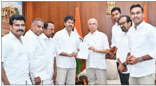
कांग्रेस के समर्थन के बाद विजय की पार्टी टीवीके के गठबंधन की संख्या 234 सदस्यीय विधानसभा में 113 तक पहुंच गई है। क्योंकि विजय ने दो

हुई है। वहीं, राज्यपाल अभी तक टीवीके के दावे से पूरी तरह संतुष्ट नहीं हैं क्योंकि पार्टी के पास बहुमत साबित करने के लिए पर्याप्त आधिकारिक आंकड़े नहीं हैं। ऐसे समझौते बहुमत का गणित तमिलनाडु की 234 सदस्यीय विधानसभा में सरकार बनाने के लिए 118 सीटों की जरूरत होती है। इस चुनाव में विजय की पार्टी टीवीके ने 108 सीटों पर जीत दर्ज की है। कांग्रेस पार्टी ने टीवीके को अपना समर्थन देने का एलान किया है। कांग्रेस के पास विधानसभा में 5 सीटें हैं।