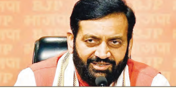
नाथ सिंह सैनी बुधवार को हरियाणा सिविल सचिवालय में विभिन्न विभागों के अधिकारियों के साथ प्रदेश में अनाज भंडारण

चंडीगढ़। हरियाणा के मुख्यमंत्री नाथ सिंह सैनी ने कहा कि अनाज को खराब होने से बचाने के लिए जरूरी है कि प्रदेश में पर्याप्त संख्या में वेयरहाउस व साइलो उपलब्ध हों। इसके लिए संबंधित विभाग विस्तृत कार्ययोजना बनाकर जल्द से जल्द अनाज भंडारण की समस्या का स्थायी समाधान निकालें। उन्होंने निर्देश दिए कि अनाज भंडारण के लिए शाहबाद व अंबाला के बीच साइलो बनाने की योजना तैयार की जाए।