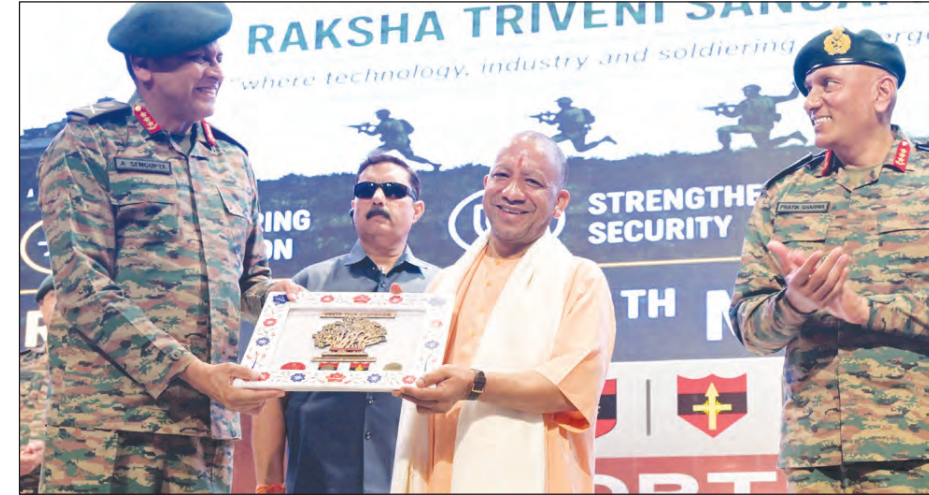
यूपी के मुख्यमंत्री योगी आदित्यनाथ जनपद प्रयागराज में 'रक्षा त्रिवेणी संगम' की थीम पर नॉर्थ टैक सिम्पोजियम (एनटीएस) 2026 का समापन समारोह में शामिल होते हुए।

एक ढांचा स्थापित करना है, जिसमें फार्मास्यूटिकल्स, जैविक उत्पाद, चिकित्सा उपकरण और सौरयंत्रण शामिल हैं। डिजिटल टेक्नोलॉजी और आईटी क्षेत्र में भी दोनों देशों ने साझेदारी मजबूत करने का फैसला किया है।