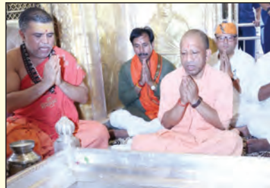
आशीर्वाद दिया। इसके बाद उनके साथ सामूहिक फोटो भी खिचाई। इसके बाद वे कालभैरव मंदिर में दर्शन पूजन के लिए पहुंचे। मंदिर में विधि

वाराणसी। उत्तर प्रदेश के मुख्यमंत्री योगी आदित्यनाथ बुधवार को वाराणसी पहुंचे। गोरखपुर से मुख्यमंत्री का हेलीकॉप्टर पुलिस लाइन में बने हेलीपैड पर उतरा तो वहां पहले से मौजूद भाजपा के पदाधिकारियों, जनप्रतिनिधियों और प्रशासनिक अफसरों ने मुख्यमंत्री की अगवानी की। पुलिस लाइन से मुख्यमंत्री कड़ी सुरक्षा के बीच वाहनों के काफिले में बड़ा लालपुर स्थित उदय प्रताप कॉलेज के अर्थशास्त्र के प्रोफेसर डॉ. राजीव कृष्ण के घर पहुंच कर मांगलिक समारोह में शामिल हुए। यहां परिजनों से कुछ देर बातचीत के बाद मुख्यमंत्री ने उन्हें बधाई दी और महिलाओं व बच्चों को