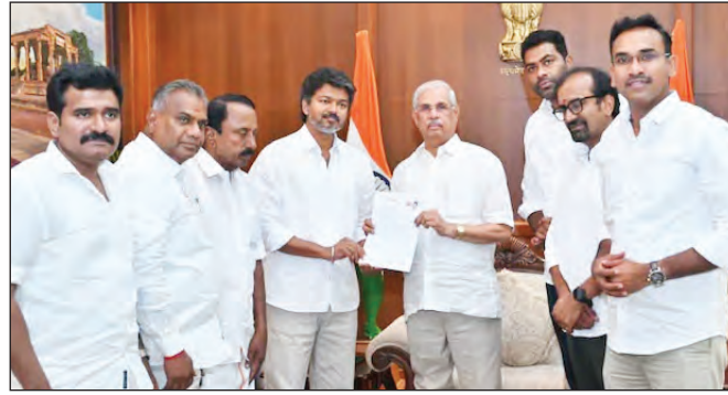
कांग्रेस के समर्थन के बाद विजय की पार्टी टीवीके के गठबंधन की संख्या 234 सदस्यीय विधानसभा में 113 तक पहुंच गई है। क्योंकि विजय ने दो

हुई है। वहीं, राज्यपाल अभी तक टीवीके के दावे से पूरी तरह संतुष्ट नहीं हैं क्योंकि पार्टी के पास बहुमत साबित करने के लिए पर्याप्त आधिकारिक आंकड़े नहीं हैं। ऐसे समझौते बहुमत का गणित तमिलनाडु की 234 सदस्यीय विधानसभा में सरकार बनाने के लिए 118 सीटों की जरूरत होती है। इस चुनाव में विजय की पार्टी टीवीके ने 108 सीटों पर जीत दर्ज की है। कांग्रेस पार्टी ने टीवीके को अपना समर्थन देने का एलान किया है। कांग्रेस के पास विधानसभा में 5 सीटें हैं।