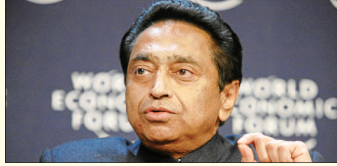
वास्तव में आरक्षण देने की है तो संसद के मौजूदा स्वरूप में ही महिलाओं को आरक्षण देने में क्या दिक्कत है। लेकिन यह करने के बजाय भाजपा आज मध्य प्रदेश विधानसभा का विशेष सत्र बुलाकर कथित महिला आरक्षण पर

फैला रही है और इस बात को छुपाने की कोशिश कर रही है कि वह परिसीमन के माध्यम से दक्षिण भारत के राज्यों के साथ अन्याय करना चाहती थी। जहाँ तक आरक्षण का सवाल है तो वर्ष 2023 में महिला आरक्षण विधेयक पहले ही पास हो चुका है और कांग्रेस पार्टी ने इसे अपना समर्थन दिया था। पूर्व सीएम ने कहा कि आज भी कांग्रेस पार्टी का स्पष्ट कहना है कि मौजूदा संसद में महिलाओं को 33 प्रतिशत आरक्षण देने का कांग्रेस पार्टी हर स्थिति में समर्थन करती है। अगर भाजपा की नियत