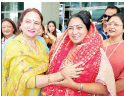
जम्मू एयरपोर्ट और कटरा में भारतीय जनता पार्टी परिवार, विशेषकर महिला मोर्चा की कार्यकर्ताओं ने दिल्ली की मुख्यमंत्री रेखा गुप्ता का आत्मीय स्वागत किया।