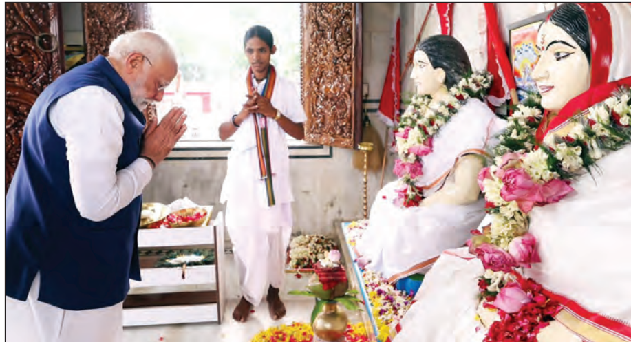
पश्चिम बंगाल में चुनाव प्रचार के बीच प्रधानमंत्री नरेंद्र मोदी ने मतुआ ठाकुर मंदिर में पूजा-अर्चना की।

जाएगी। किसानों के मुद्दे पर बोलते हुए मोदी ने कहा कि केंद्र सरकार ने जूट के न्यूनतम समर्थन मूल्य को दोगुना किया है और इसके उपयोग को बढ़ावा दिया है, जबकि तृणमूल सरकार उद्योगों को पनपने नहीं दे रही।