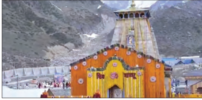
महत्वपूर्ण अवसरों पर आयोजित कार्यक्रमों का प्रारंभिक प्रस्ताव राज्यपाल, उत्तराखंड को अनुमोदनार्थ प्रस्तुत किया गया था।

उठाया गया, किंतु आज तक इस दिशा में कोई ठोस पहल नहीं हो सकी है। उन्होंने कहा कि वर्ष 2021-22 में उत्तराखंड सरकार द्वारा इस मार्ग का सर्वेक्षण भी कराया गया था, परंतु उसके बाद की आवश्यक कार्यवाही अब तक लंबित है। वर्ष 2022 में सीमा सड़क संगठन द्वारा भी इस विषय पर सकारात्मक पहल की गई थी। उत्तराखंड राज्य की दुर्गम भौगोलिक परिस्थितियों, सीमांत क्षेत्रों की सामरिक महत्ता, आपदा प्रबंधन की आवश्यकता व क्षेत्रीय विकास को ध्यान में रखते हुए बीआरओ द्वारा कुछ