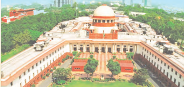
जुड़े हैं। केरल हाईकोर्ट ने 1991 में सबरीमाला में मासिक धर्म वाली

ठहराया जा सकता है। अगर राज्य चाहे कि अन्य संप्रदायों के लोगों को भी अनुमति दी जाए, तो वह सुधार के रूप में कानून बना सकता है। धार्मिक आस्था के 66 मामले सुप्रीम कोर्ट में 9 जजों की संवैधानिक बेंच सबरीमाला मंदिर में महिलाओं की एंट्री से जुड़े मामले पर सुनवाई कर रही है। इसके साथ धार्मिक आस्था के 66 मामले और