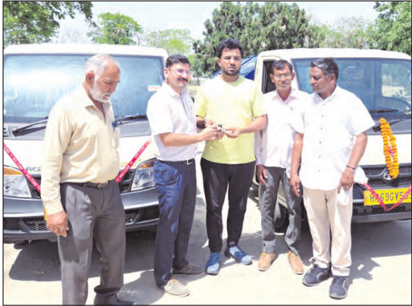
बुधवार को आयोजित कार्यक्रम में विधायक ने गार्बेज वैन का

देवा कार्यालय में बुधवार को आयोजित कार्यक्रम में विधायक ने गार्बेज वैन का उद्घाटन किया