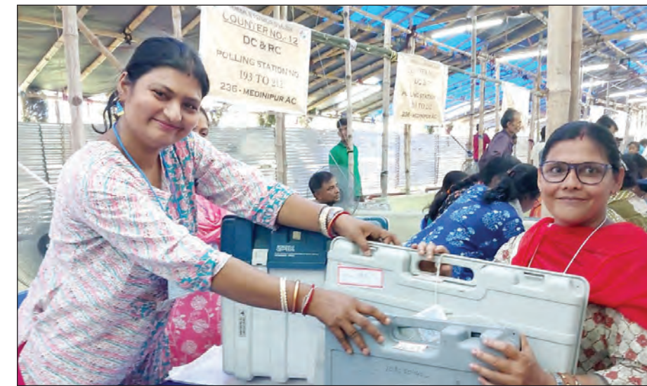
22 अप्रैल, 2026 को पश्चिम बंगाल के पश्चिम मेदिनीपुर स्थित मेदिनीपुर कॉलेज के एक वितरण केंद्र पर, मतदान अधिकारी पश्चिम बंगाल विधानसभा चुनाव 2026 के पहले चरण के लिए आवश्यक इलेक्ट्रॉनिक वोटिंग मशीन और अन्य सामग्री ले जा रहे हैं।

गुरुग्राम। हरियाणा सरकार पांच साल की सेवा पूरी कर चुके गुप डी के कर्मचारियों को प्रमोशन देगी। इसके लिए 27 अप्रैल को विधानसभा के विशेष सत्र में विधेयक पारित किया जाएगा। यह फैसला बुधवार को मुख्यमंत्री नयब सैनी की अध्यक्षता में हुई मंत्रिमंडल की बैठक में लिया गया। इस सत्र के दौरान 'हरियाणा क्लेरिकल सर्विसेज रिफॉर्म एंड कंडीशंस ऑफ सर्विसेज बिल, 2026' पेश किया जाएगा। प्रस्तावित कानून का मकसद सरकारी कर्मचारियों, खासकर कॉमन कैडर सिस्टम के तहत 'गुप डी' श्रेणी के कर्मचारियों के लिए करियर में आगे बढ़ने के मौकों को काफी बेहतर बनाना है।