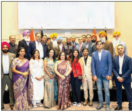
रक्षा मंत्री राजनाथ सिंह जर्मनी में भारतीय प्रवासियों के साथ एक सामूहिक तस्वीर में।