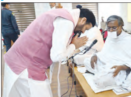
हरियाणा के मुख्यमंत्री नायब सिंह सैनी रविवार को करनाल में श्री आत्म मनोहर जैन आराधना मंदिर में आयोजित विशेष धर्म सभा में पहुंचे।