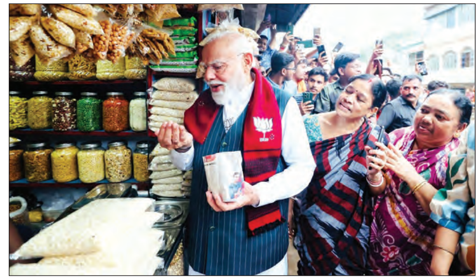
प्रधानमंत्री नरेंद्र मोदी चुनावी रैलियों के दौरान पश्चिम बंगाल के झाड़ाग्राम में झालमुड़ी की एक स्थानीय दुकान पर रुकते हैं और स्थानीय दुकान से झालमुड़ी खरीद का लोगों संग खाते हैं।

ईरान ने काफी हद तक अपना रुख स्पष्ट कर दिया है। ईरान ने बिना लागू लगेट के कहा कि वह होर्मुज जलडमरूमध्य को तभी खोलेगा, जब अमेरिका की सेना उसके बंदरगाहों की घेराबंदी खत्म कर लौट जाएगी।