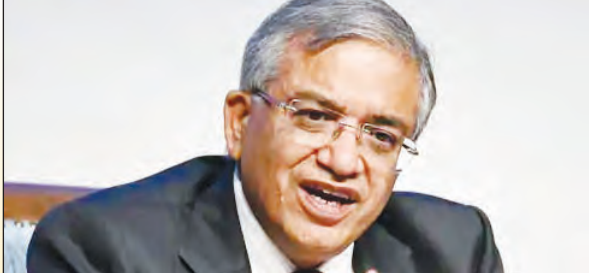
बिल के खिलाफ 230 सांसदों ने वोट डाला था।

करते। विपक्ष ने 200 हस्ताक्षर हासिल करने का लक्ष्य रखा नए नोटिस में विपक्ष कम से कम 200 सांसदों का समर्थन जुटाने की कोशिश कर रहा है। इसकी बड़ी वजह हाल ही में लोकसभा में गिरा महिला आरक्षण संशोधन बिल है। लोकसभा में शुक्रवार को संविधान में 131वां संशोधन बिल वोटिंग के बाद गिर गया।