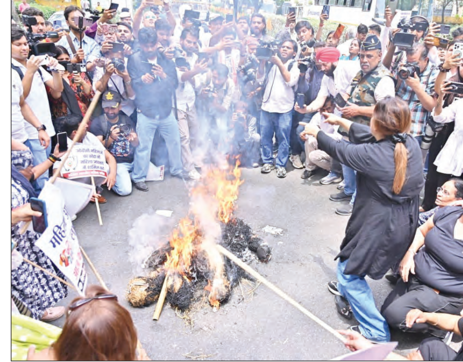
कांग्रेस ने प्रदर्शन करते हुए महिला आरक्षण बिल को तुरंत 543 सीटों पर लागू करने की मांग की।