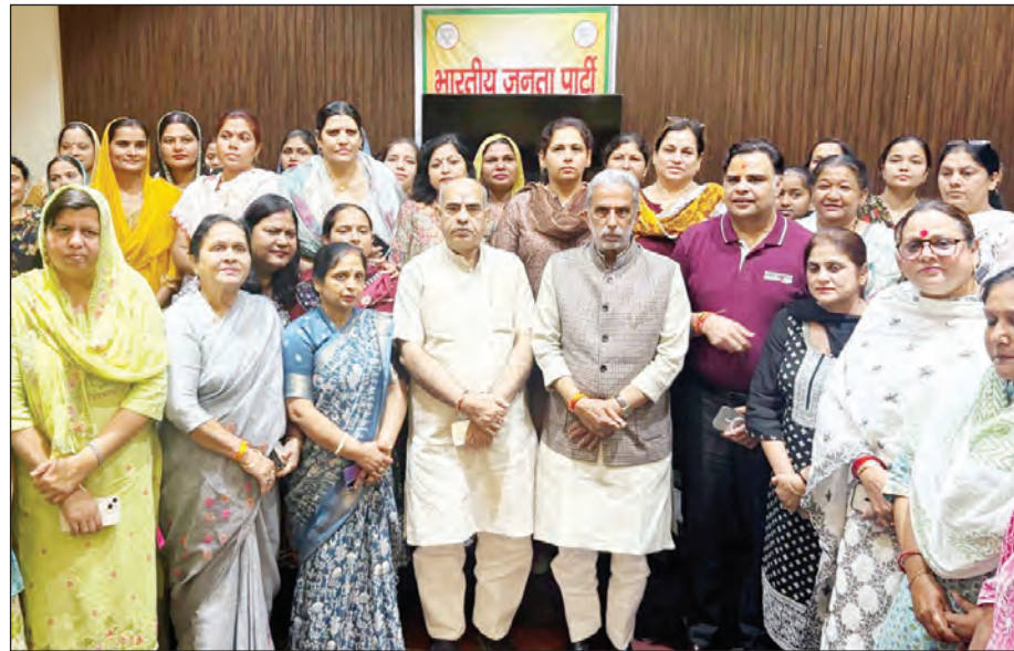
फरीदाबाद : इंदिरा-प्रियंका तक सिमटी कांग्रेस की राजनीति, आम महिला उपेक्षित : कृष्णपाल गुर्जर

आगे बढ़ने के लिए प्रेरित करेंगे। जिला प्रशासन इस कार्यक्रम को लेकर तैयारियों में जुटा हुआ है। अधिकारियों का मानना है कि सचिन तेंदुलकर का यह दौरा जिले के बच्चों के लिए प्रेरणादायक साबित होगा और उन्हें खेल के क्षेत्र में आगे बढ़ने की नई ऊर्जा देगा। उल्लेखनीय है कि दंतेवाड़ा में सचिन तेंदुलकर की संस्था के माध्यम से खेल गतिविधियों को बढ़ावा दिया जा रहा है। जिसके तहत जिले के 25 से अधिक स्कूलों और आश्रमों में खेल मैदान विकसित किए गए हैं और बच्चों को प्रशिक्षण की सुविधाएं उपलब्ध कराई जा रही हैं।