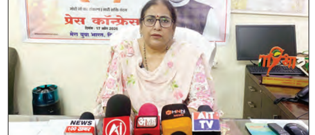
रफ़ी मार्ग के निकट तक आयोजित की जाएगी। कार्यक्रम की शुरुआत सुबह 7 बजे करण और 'नारी शक्ति संकल्प' के साथ होगी, जिसके बाद प्रतिभागी 2-3 किलोमीटर की दौड़ लगाएंगी। कार्यक्रम के समापन पर सभी प्रतिभागियों को प्रमाण-पत्र वितरित किए जाएंगे। राज्य

टीएम एक्शन इंडिया नई दिल्ली: महिला सशक्तिकरण और विकसित भारत के संकल्प को नई ऊर्जा देने के लिए 18 अप्रैल 2026 को देश की राजधानी के ऐतिहासिक 'कर्तव्य पथ' पर 'नारी शक्ति वंदन रन' का आयोजन होने जा रहा है। 'मेरा युवा भारत' द्वारा आयोजित इस दौड़ का मुख्य उद्देश्य महिलाओं की लोकतांत्रिक भागीदारी को बढ़ाना और नारी शक्ति से संबंधित ऐतिहासिक विधेयकों के प्रति जागरूकता फैलाना है। सुबह की पहली किरण के साथ शुरू होगा कारवां दिल्ली में यह रन कर्तव्य पथ के हेक्सगन क्रॉसिंग से प्रारंभ होकर