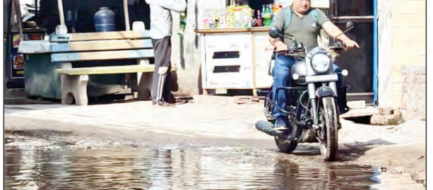
नौनिहालों का रास्ता हुआ दूषर सड़क पर भरे इस काले और बदबूदार पानी का सबसे बुरा असर स्कूली बच्चों पर पड़ रहा है। पास के स्कूलों में जाने वाले छोटे-छोटे बच्चों को इसी गंदे पानी के बीच से होकर गुजरना पड़ता है, जिससे उनके जूते-जुआब और कपड़े खराब हो जाते हैं। बच्चों के अभिभावकों का कहना है कि जलभराव के कारण आए दिन बच्चे फिसलकर गिर जाते हैं, जिससे उन्हें चोट लगने और संक्रमण फैलने का खतरा बना रहता है।