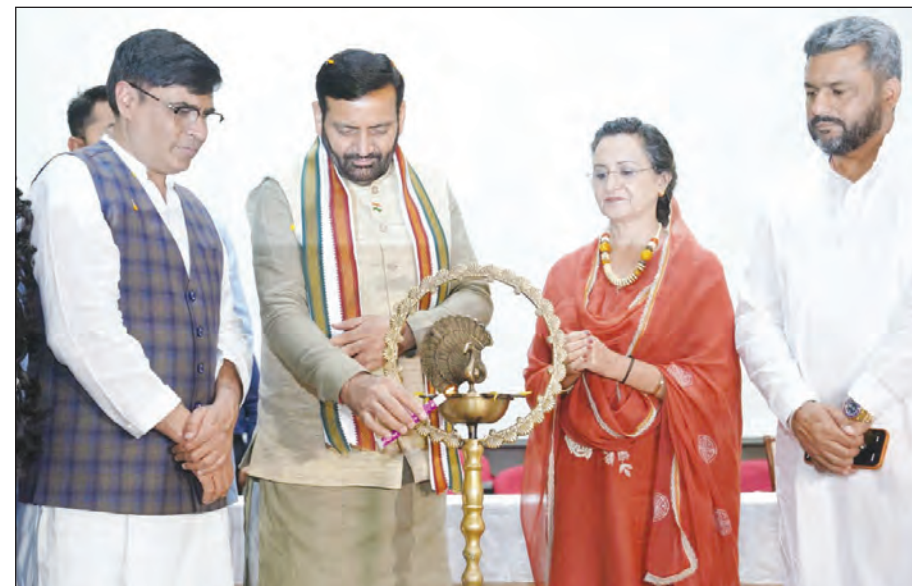
हरियाणा के मुख्यमंत्री नायब सिंह सेनी कबीर ने संत कबीर जी के जीवन एवं शिक्षाओं पर आयोजित एक सेमिनार का दीप प्रज्वलित कर उद्घाटन करते हुए।

नई दिल्ली। राज्यसभा में शुक्रवार को हरिवंश लगातार तीसरी बार उपसभापति निर्वाचित हुए। विपक्ष की ओर से कोई उम्मीदवार नहीं उतारे जाने के कारण उनका निर्वाचन निर्विरोध हुआ। इसके साथ ही वह इस पद पर लगातार तीसरी बार आसीन होने वाले सदस्य बन गए हैं। नेता सदन जगत प्रकाश नड्डा और विपक्ष के नेता मल्लिकार्जुन खरगे ने उन्हें आसन तक पहुंचाया और उपसभापति की कुर्सी पर बैठाया। प्रधानमंत्री नरेन्द्र मोदी ने हरिवंश को पुनः निर्वाचित होने पर बधाई देते हुए उच्च सदन के संचालन में उनके अनुभव और योगदान की सराहना की।