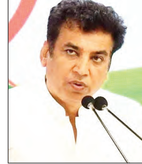
कि विजेन्द्र गुप्ता को जेड प्लस सुरक्षा देने के पीछे उन्हे मिली ई-मेल पर धमकियां और विधानसभा परिसर तक उनके चाहने तक पहुंचकर किसी व्यक्ति द्वारा सदिध वस्तु रखने में सफल होना था, जो सुरक्षा में चूक एक बड़ा मामला है। मैं केन्द्रीय गृहमंत्रालय से पूछना चाहता हूं कि आईएसआई से धमकी भरे ईमेल की क्या सुरक्षा एजेंसियों ने जांच भी की है? अगर जांच की है तो उसको सार्वजनिक क्यों नहीं किया? दिल्ली विधानसभा अध्यक्ष, लोकतांत्रिक संस्थाओं, स्कूलों, कॉलेजों व अन्य संस्थाओं को बम से उड़ाने की लगातार धमकी मिलने के बावजूद कोई कार्यवाही नहीं होना सुरक्षा एजेंसियों की विफलता को दर्शाता है। देवेन्द्र यादव ने कहा कि दिल्ली सरकार का कहना कि दिल्ली विधानसभा अध्यक्ष और विधानसभा की सुरक्षा अहम है, तो क्या दिल्ली की जनता जिसके साथ खुलेआम बढ़ते अपराधों, अराजकता अत्याचार, लूट, डकैती, गोलीबारी, अपहरण, महिलाओं के साथ यौन उत्पीड़न, छेड़छाड़ और बलात्कार जैसी घटनाएं घट रही है। उनकी सुरक्षा अहम नहीं है।

टीएम एक्शन इंडिया नई दिल्ली: दिल्ली प्रदेश कांग्रेस कमेटी के अध्यक्ष देवेन्द्र यादव ने दिल्ली की बिगड़ती कानून व्यवस्था पर चिंता व्यक्त करते हुए भाजपा की ट्रिपल इंजन सरकार को दिल्लीवासियों की सुरक्षा प्राथमिकता के तौर पर सुनिश्चित करने की जगह लोकतांत्रिक संस्थाओं के विरुद्ध किसी भी प्रकार के खतरे के प्रति जीरो टॉलरेंस की नीति अपनाने और विधायी प्रक्रिया की गरिमा बनाये रखने की आड़ में अपने नेताओं को जेड प्लस सिक्योरिटी देने की निंदा की। भाजपा ने पहले दिल्ली भाजपा अध्यक्ष विरेन्द्र सचदेवा और अब विधानसभा अध्यक्ष विजेन्द्र गुप्ता को जेड प्लस सुरक्षा प्रदान करके यह साबित कर दिया है कि दिल्ली असुरक्षित है। देवेन्द्र यादव ने कहा