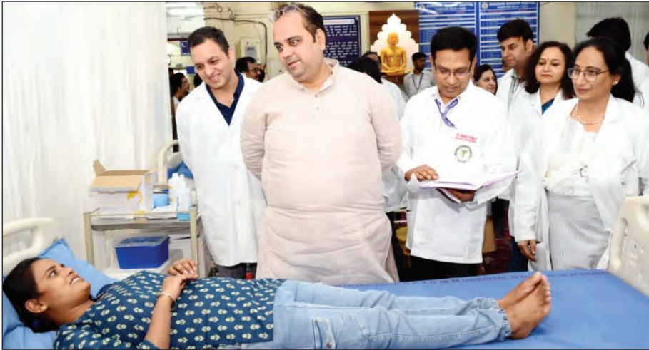
की तरफ से पूरा सहयोग और सहायता देने का भरपूर आग्रह किया। स्वास्थ्य मंत्री ने आगे कहा कि रक्तदान एक महान कार्य है, जो दूसरों का जीवन बचाता है। ऐसी पहलें न केवल जरूरतमंद मरीजों