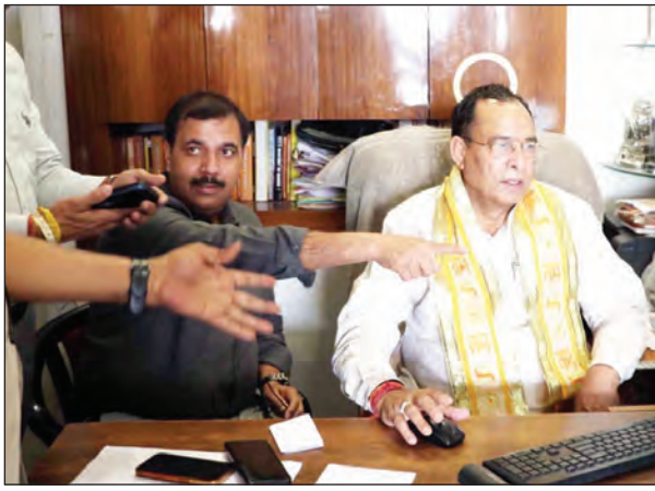
सटीकता सुनिश्चित करने की दिशा में एक बड़ा कदम है।

विजन को मजबूत करने वाला एक नायाब कदम है। भाजपा प्रदेश अध्यक्ष बड़ौली ने कहा कि राज्य में जनगणना का पहला चरण 1 मई से 30 मई 2026 तक चलेगा, जिसमें मकानों की गणना और सूचीकरण किया जाएगा। इससे पहले 16 अप्रैल से 30 अप्रैल तक नागरिकों को स्व-जनगणना की सुविधा दी गई है, जिसके तहत वे घर बैठे मोबाइल, टैबलेट या कंप्यूटर के माध्यम से अपनी जानकारी दर्ज करा सकते हैं। प्रदेश अध्यक्ष ने कहा कि स्व जनगणना की यह पहल डेटा की