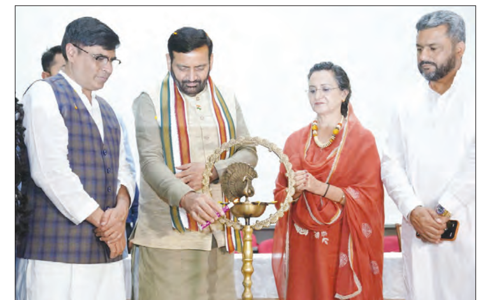
हरियाणा के मुख्यमंत्री नायब सिंह सेनी कबीर ने संत कबीर जी के जीवन एवं शिक्षाओं पर आयोजित एक सेमिनार का दीप प्रज्वलित कर उद्घाटन करते हुए।

नई दिल्ली। राज्यसभा में शुक्रवार को हरिवंश लगातार तीसरी बार उपसभापति निर्वाचित हुए। विपक्ष की ओर से कोई उम्मीदवार नहीं उतारे जाने के कारण उनका निर्वाचन निर्विरोध हुआ। इसके साथ ही वह इस पद पर लगातार तीसरी बार आसीन होने वाले सदस्य बन गए हैं। नेता सदन जगत प्रकाश नड्डा और विपक्ष के नेता मल्लिकार्जुन खरेगे ने उन्हें आसन तक पहुंचाया और उपसभापति की कुर्सी पर बैठाया। प्रधानमंत्री नरेन्द्र मोदी ने हरिवंश को पुनः निर्वाचित होने पर बधाई देते हुए उच्च सदन के संचालन में उनके अनुभव और योगदान की सराहना की।