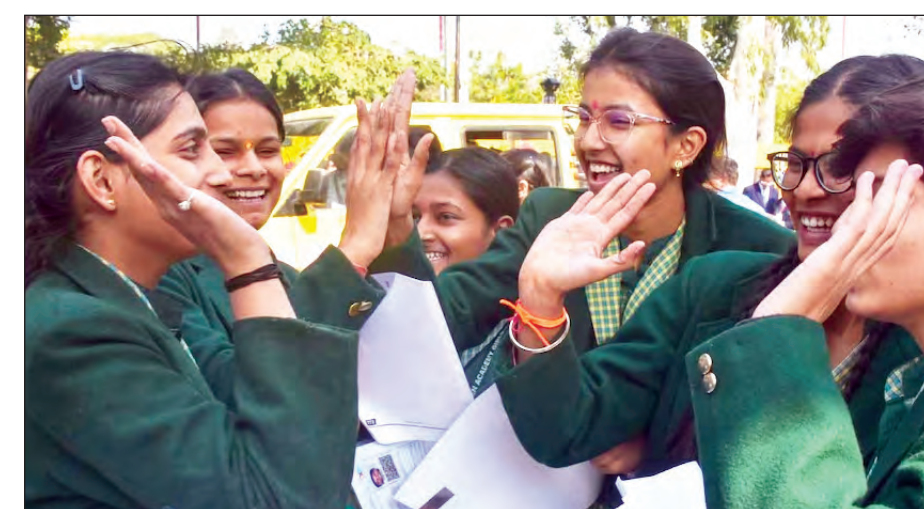
सीबीएसई कक्षा 10 के नतीजे घोषित, 93.70 फीसदी उत्तीर्ण, क्षेत्रवार प्रदर्शन में त्रिवेंद्रम और विजयवाड़ा अखिल: केंद्रीय माध्यमिक शिक्षा बोर्ड (सीबीएसई) ने बुधवार को कक्षा 10 की परीक्षा का परिणाम घोषित कर दिया है। इस वर्ष कुल 93.70 प्रतिशत विद्यार्थी उत्तीर्ण हुए, जो पिछले वर्ष के 93.66 प्रतिशत की तुलना में 0.04 प्रतिशत की मामूली वृद्धि दर्शाता है।

लगाया कि तृणमूल कांग्रेस के नेताओं ने शिक्षक भर्ती घोटाले में लगभग 300 करोड़ और उत्तर बंगाल के लिए केंद्र द्वारा जारी बाढ़ राहत फंड से करीब 100 करोड़ रुपये का दुरुपयोग किया।