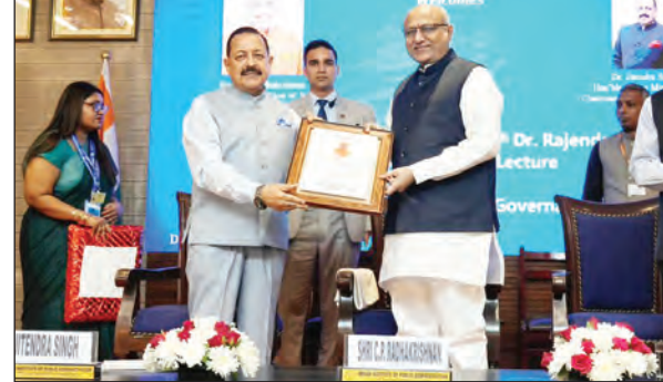
उपराष्ट्रपति ने कहा कि दुनिया आज एआई के युग में प्रवेश कर चुकी है, जहां मशीनों सीख रही हैं और सिस्टम सोचने लगे हैं। एआई सरकारों को नागरिकों की जरूरतों को बेहतर समझने और सेवाएं अधिक प्रभावी ढंग से प्रदान करने की क्षमता दे रहा है। उन्होंने कहा कि 2047 तक विकसित भारत के लक्ष्य को हासिल करने में एआई महत्वपूर्ण भूमिका निभाएगा। एआई से शासन अधिक तेज, पारदर्शी

अच्छे शासन और समावेशी समाज निर्माण के लिए जिम्मेदारी और दूरदृष्टि के साथ अपनाया जाना चाहिए