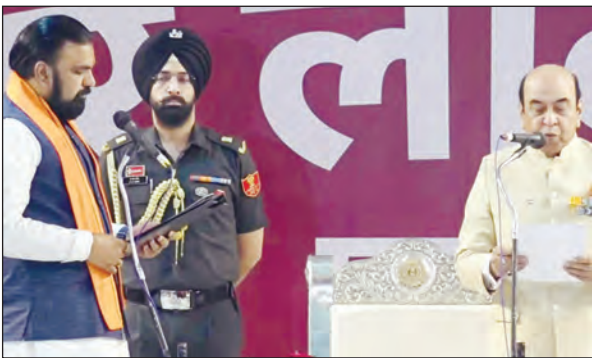
बिहार में जो भी काम हो रहे हैं, उसका संचालन अच्छे ढंग से हो रहा है: मुख्यमंत्री सम्राट चौधरी