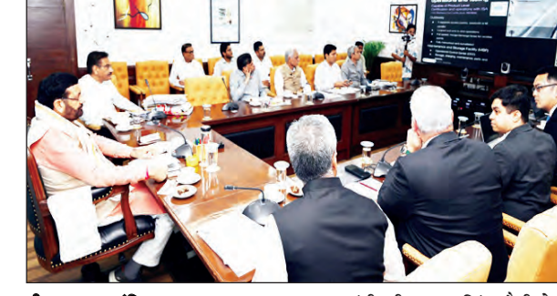
टीम एक्शन इंडिया चंडीगढ़: हरियाणा में शहरी परिवहन व्यवस्था को आधुनिक, स्मार्ट और टिकाऊ बनाने की दिशा में राज्य सरकार ने एक और बड़ा और दूरदर्शी कदम उठाया है। शहरों में अत्याधुनिक पौड टेक्सी (ग्लाइडवेज) प्रणाली को लागू करने की संभावनाओं पर सरकार गंभीरता से मंथन कर रही है, जिससे प्रदेश में स्मार्ट मोबिलिटी का नया युग शुरू होने की उम्मीद है। इसी कड़ी में मुख्यमंत्री नायब सिंह सैनी से बुधवार को चंडीगढ़ स्थित संत कबीर कुटीर में जापान की प्रतिष्ठित कंपनी सुजुकी मोटर कार्पोरेशन तथा ग्लाइडवेज कंपनी के उच्च स्तरीय प्रतिनिधिमंडल ने शिष्टाचार भेंट की।

लगाया कि तृणमूल कांग्रेस के नेताओं ने शिक्षक भर्ती घोटाले में लगभग 300 करोड़ और उत्तर बंगाल के लिए केंद्र द्वारा जारी बाढ़ राहत फंड से करीब 100 करोड़ रुपये का दुरुपयोग किया।