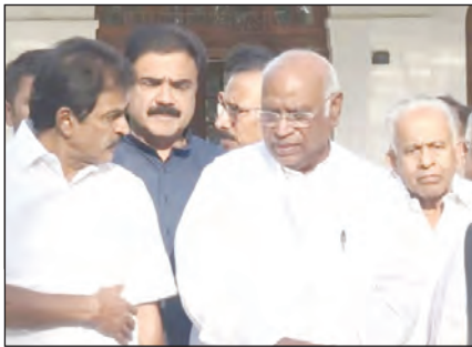
महिला आरक्षण कानून और संसदीय सीटों के विस्तार को लेकर विपक्षी इंडी गटबंधन के शीर्ष नेताओं ने बुधवार को कांग्रेस अध्यक्ष मल्लिकार्जुन खरगे के आवास पर बैठक की।