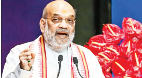
ममता बनर्जी के नेतृत्व वाली सरकार की विदाई तय है और इसकी शुरुआत उत्तर बंगाल से होगी। उन्होंने कहा कि मोदी ने 12 साल गुजराने में और 12 साल केन्द्र में शासन किया, लेकिन उन पर एक पैसे के भ्रष्टाचार का भी आरोप नहीं लगा। अमित शाह ने आरोप

टीम एक्शन इंडिया कोलकाता। केंद्रीय गृह मंत्री और भारतीय जनता पार्टी (भाजपा) के वरिष्ठ नेता अमित शाह ने बुधवार को दावा किया कि पश्चिम बंगाल में सत्ता में आने पर तृणमूल कांग्रेस द्वारा जनता से लूटा गया रूपाय पैसा ब्याज समेत वापस दिलाएगी। उन्होंने यह भी कहा कि प्रधानमंत्री नरेन्द्र पर 24 साल के लंबे शासनकाल के बावजूद भ्रष्टाचार का एक भी आरोप नहीं लगा है। जुलाई 2014 में उत्तराखण्ड के राजगंज में चुनावी सभा को संबोधित करते हुए शाह ने कहा कि राज्य में मुख्यमंत्री