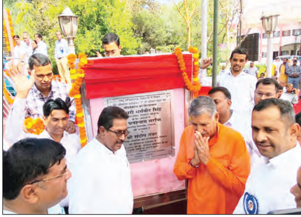
कहा कि बाबा साहेब डॉ. अंबेडकर एक महान विभूति हुए हैं, जिन्होंने संविधान में दिए