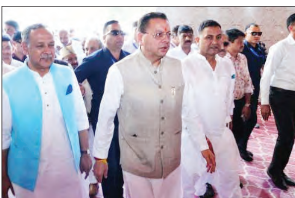
बजे बहुप्रतीक्षित कॉरिडोर का उद्घाटन करेंगे और उसके बाद जनसभा को संबोधित भी करेंगे। छह-लेन एक्सेस कंट्रोल दिल्ली-देहरादून इकोनॉमिक कॉरिडोर 213 किलोमीटर लंबा है और करीब 12 हजार करोड़ रुपये की लागत से तैयार किया गया है। यह

टीम एक्शन इंडिया देहरादून। प्रधानमंत्री नरेन्द्र मोदी कल यानी 14 अप्रैल को देहरादून पहुंच रहे हैं। प्रधानमंत्री दिल्ली-देहरादून इकोनॉमिक कॉरिडोर का लोकार्पण करने के साथ ही वाइल्ड लाइफ कॉरिडोर का निरीक्षण भी करेंगे। प्रेस सूचना ब्यूरो ने सोमवार को प्रधानमंत्री का कार्यक्रम जारी किया है। निर्धारित कार्यक्रम के अनुसार प्रधानमंत्री सुबह करीब 11:15 बजे उत्तर प्रदेश के सहारनपुर में कार्यक्रम में शामिल होने के बाद करीब 11:40 बजे देहरादून पहुंचेंगे। डाट काली मंदिर में पूजा-अर्चना के बाद दोपहर करीब 12:30