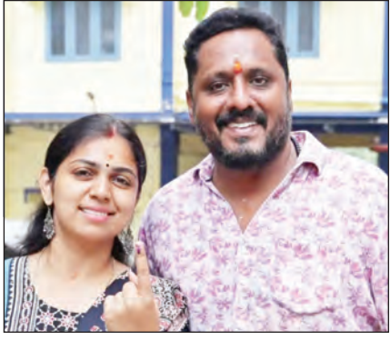
केरलम में वोट देने के बाद मीडिया को स्याही लगी हुई उंगली दिखाते हुए मतदाता।