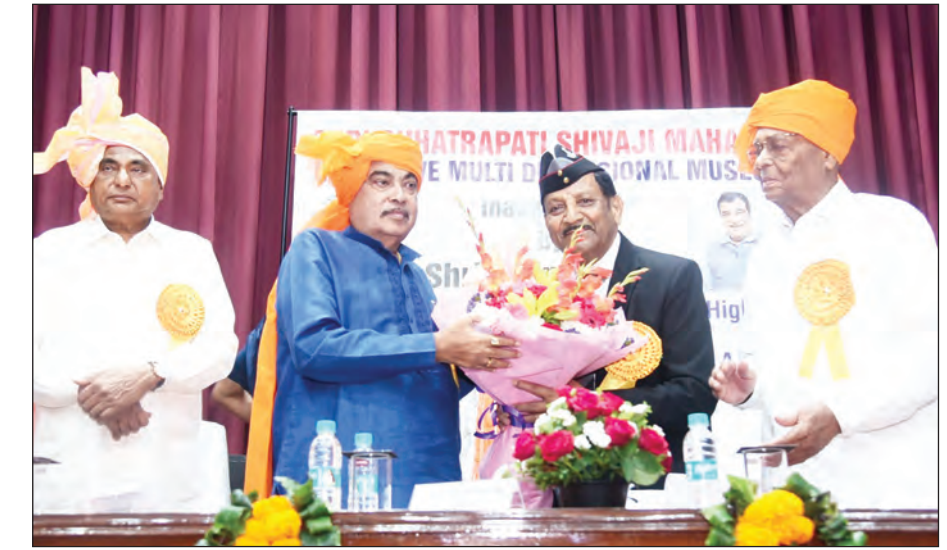
केंद्रीय सड़क परिवहन एवं राजमार्ग मंत्री नितिन गडकरी ने गुरुवार को दिल्ली के कुतुब इंस्टीट्यूशनल एरिया में स्थित छत्रपति शिवाजी भवन में एक 'बहुआयामी संग्रहालय' का उद्घाटन किया।