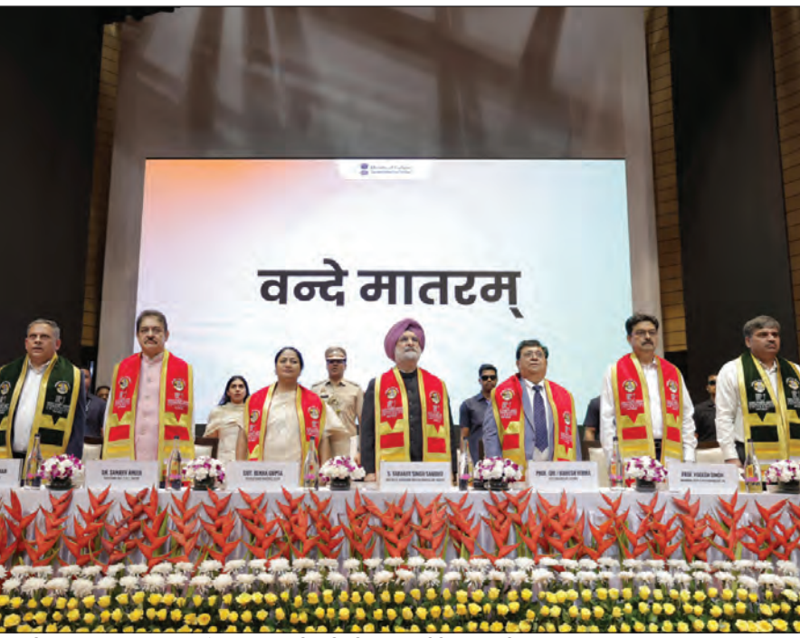
दिल्ली के उपराज्यपाल और मुख्यमंत्री जीजीएसआईपीयू के दीक्षांत समारोह में शामिल हुए।