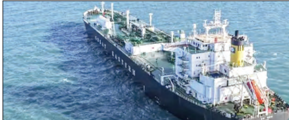
इससे पहले आया था भारतीय जहाज 'ग्रीन सावरी' सूत्रों के अनुसार, 28 फरवरी को युद्ध शुरू होने के बाद से, एलपीजी ले जाने वाला यह आठवां भारतीय जहाज है। जिसने इस जलडमरूमध्य को

टीएम एक्शन इंडिया नई दिल्ली। भारत के 8वें जहाज ग्रीन आशा ने सफलतापूर्वक होर्मुज को पार लिया है। एएनआई से मिली जानकारी के अनुसार भारतीय जहाज 'ग्रीन आशा' पर लगभग 20,000 टन एलपीजी होने का अनुमान है। भारतीय समय के अनुसार रविवार को दोपहर 3:30 बजे ग्रीन आशा ईरान के लारक, केशम और होर्मुज द्वीपों के बीच ईरानी जल क्षेत्र से गुजरने के बाद जलडमरूमध्य के पूर्व में प्रवेश कर चुका था।