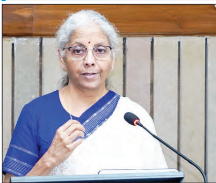
वित्त मंत्री निर्मला सीतारमण एक कार्यक्रम को संबोधित करती हुई।