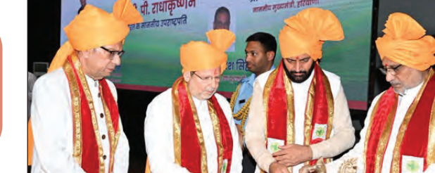
दीनबंधू छोट्टराम विज्ञान एवं प्रौद्योगिक विश्वविद्यालय के दीक्षांत समारोह में सीएम को मुख्यमंत्री नायब सिंह सैनी ने कहा कि हरियाणा सरकार का शिक्षा, शोध और कौशल विकास पर विशेष फोकस है। कार्यक्रम में मुख्यमंत्री नायब सिंह सैनी मुख्य अतिथि के रूप में शामिल हुए। देश के उपराष्ट्रपति सीपी राधाकृष्णन तथा हरियाणा के राज्यपाल और कुलाधिपति असीम कुमार घोष की गरिमामयी उपस्थिति रही। समारोह में विद्यार्थियों, शिक्षकों और अभिभावकों की बड़ी संख्या मौजूद रही। मुख्यमंत्री ने उपाधि प्राप्त करने वाले विद्यार्थियों को बधाई देते हुए कहा कि यह दिन विश्वविद्यालय के इतिहास का महत्वपूर्ण पड़ाव है और विद्यार्थियों के जीवन का अविस्मरणीय क्षण है। शिक्षकों और अभिभावकों के योगदान को भी उन्होंने सफलता का आधार

बताया। मुख्यमंत्री ने कहा कि दीनबंधू छोट्टराम विज्ञान एवं प्रौद्योगिक विश्वविद्यालय महान समाज सुधारक चौधरी छोटे राम के नाम पर स्थापित है। छोटे राम ने शिक्षा को गरीबी और अज्ञानता से मुक्ति का सबसे बड़ा साधन बताया था। विश्वविद्यालय आज उनके आदर्शों को आधुनिक विज्ञान और तकनीक के साथ जोड़ते हुए राष्ट्र निर्माण में महत्वपूर्ण भूमिका निभा रहा है। उन्होंने कहा कि हरियाणा ने शिक्षा, खेल, संस्कृति, शोध और औद्योगिक क्षेत्र में उल्लेखनीय प्रगति की है। राज्य का लक्ष्य है कि हर युवा आत्मनिर्भर बने और वैश्विक स्तर पर प्रतिस्पर्धा करने में सक्षम हो। अनुसंधान और नवाचार को बढ़ावा देने के लिए राज्य सरकार ने हरियाणा राज्य अनुसंधान कोष के तहत 20 करोड़ रुपये का प्रावधान किया है। वर्ष 2025-26 में 350 से अधिक शोध प्रस्ताव प्राप्त हुए, जिनमें से लगभग 90 प्रस्तावों को चयनित किया गया।