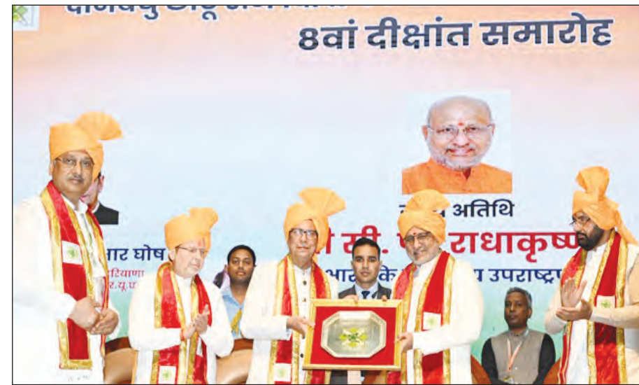
दीनबंधू छोट्टराम विज्ञान एवं प्रौद्योगिक विश्वविद्यालय के दीक्षांत समारोह में उपराष्ट्रपति सीपी राधाकृष्णन तथा हरियाणा के राज्यपाल और कुलाधिपति असीम कुमार घोष, मुख्यमंत्री नायब सिंह सैनी के साथ-साथ अन्य अतिथिगण मौजूद रहे।