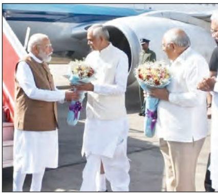
प्रधानमंत्री नरेन्द्र मोदी का अहमदाबाद पहुंचने पर मुख्यमंत्री और राज्यपाल ने स्वागत किया। इसके बाद वे कोबा पहुंचे।