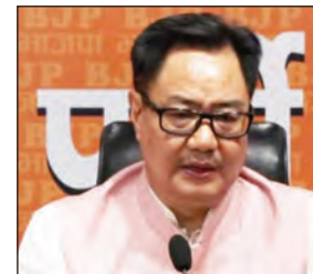
रही है। लेकिन प्रस्तावित संशोधन विधेयक केवल भारत में विदेशी धन के विनियमन के लिए, किसी भी अवैध गतिविधि में धन के दुरुपयोग को रोकने के लिए लाया गया है। उन्होंने कहा कि विदेशों से अवैध रूप से पैसा आता है और उसका इस्तेमाल राष्ट्रीय सुरक्षा के खिलाफ किया जाता है। इसलिए राष्ट्रीय सुरक्षा और राष्ट्रीय

टीम एक्शन इंडिया नई दिल्ली। विदेशी अंशदान (विनियमन) (एफसीआरए) संशोधन विधेयक, 2026 को लेकर विपक्षी दलों के आरोपों को खारिज करते हुए केन्द्रीय मंत्री किरन रिजिजू ने कहा कि किसी भी अवैध गतिविधियों में धन के दुरुपयोग को रोकने के लिए यह विधेयक लाया गया है। मंगलवार को भाजपा मुख्यालय में पत्रकारों से वार्ता करते हुए किरन रिजिजू ने कहा कि केरल में वामदलों और कांग्रेस द्वारा कुछ अफवाहें फैलाई जा रही हैं कि भारत सरकार विभिन्न धार्मिक संगठनों की गतिविधियों को रोकने के लिए एफसीआरए संशोधन विधेयक ला