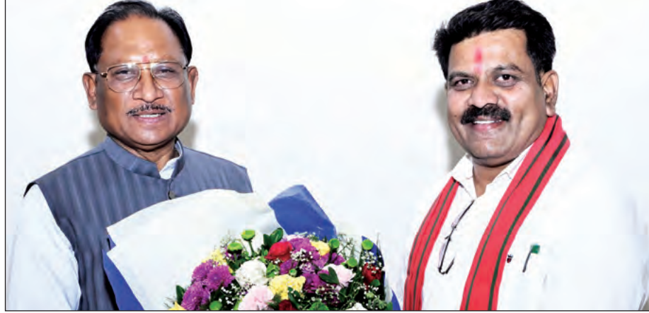
छत्तीसगढ़ में नक्सलवाद की समाप्ति की दिशा में मिली ऐतिहासिक सफलता के बीच मुख्यमंत्री विष्णुदेव साय से उनके नवा रायपुर स्थित निवास कार्यालय में उपमुख्यमंत्री विजय शर्मा ने सौजन्य मुलाकात की।

प्रधानमंत्री ने कहा कि कोविड-19 महामारी के दौरान ही भारत ने यह संकल्प लिया था कि देश सेमीकॉनडक्टर क्षेत्र में आत्मनिर्भर बनेगा और वैश्विक हब के रूप में उभरेगा। आज उस दिशा में तेजी से प्रगति हो रही है। कंपनियां वैश्विक सहयोग के माध्यम से इस क्षेत्र में अपनी मजबूत उपस्थिति दर्ज करवाएंगी। इस प्लांट में एडवांस्ड इंटेलिजेंट पावर मांड्युल्स (आईपीएमएस) का निर्माण किया जाएगा।