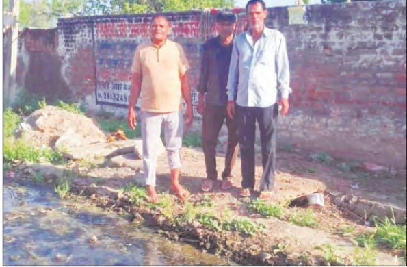
रहे हैं, जिससे दूषित पानी आसपास के खेतों में भर गया है।

बारिश या पानी का बहाव बढ़ते ही नाले उफान पर आ जाते हैं और गंदा पानी खेतों में भर जाता है।