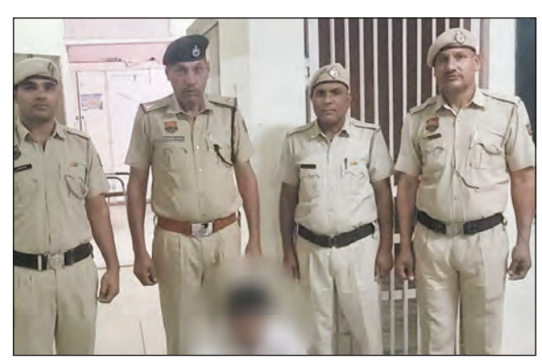
आरोपी को गिरफ्तार किया है। पुलिस टीम को गुप्त सूचना