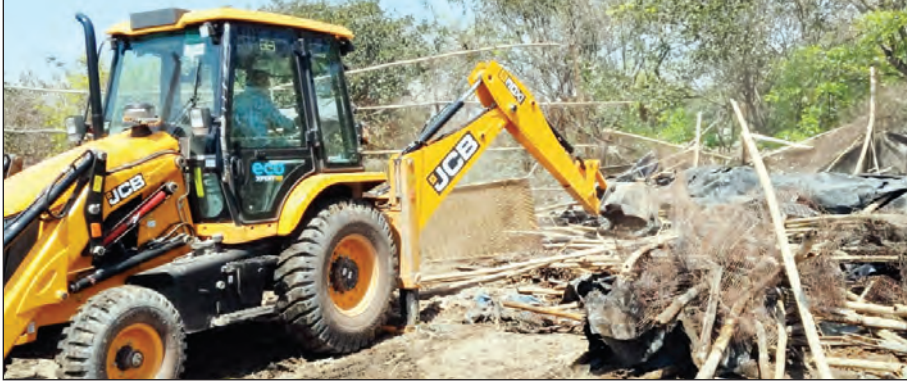
दौरान सुरक्षा के मद्देनजर भारी पुलिस बल भी मौके पर तैनात रहा। अवैध निर्माण पर प्रहार: दिल्ली में

टीम एक्शन इंडिया/महेन्द्र सिंह नई दिल्ली: नरेला विधानसभा क्षेत्र स्थित प्लॉट-13, सेक्टर ए-6 में डीडीए की जमीन पर पिछले काफी सालों से अवैध रूप से चल रहे कसाईखाने (जहां खुले में रोजाना हजारों मुर्गे कोटे जाते थे) पर दिल्ली हाई कोर्ट के हस्तक्षेप के बाद डीडीए ने अवैध कब्जों के खिलाफ कड़ी कार्रवाई करते हुए बुलडोजर चलाकर अतिक्रमण मुक्त कराया। इस दौरान सरकारी जमीन पर बने अवैध निर्माणों को जर्माटोज किया गया। इस कार्रवाई का उद्देश्य सरकारी जमीन को वापस लेना और अतिक्रमण को हटाना है। इस