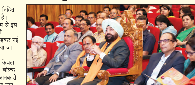
विश्वविद्यालय के प्रयासों की सराहना करते हुए कहा कि यह चैटबॉट एक

उपनिषद और प्राचीन सभ्यता में निहित ज्ञान आज भी अत्यंत प्रासंगिक है। प्रज्ञान-जैसे प्लेटफॉर्म के माध्यम से इस अमूल्य ज्ञान को 21वीं सदी की आधुनिक तकनीक के साथ जोड़कर नई पीढ़ी तक प्रभावी रूप से पहुंचाया जा सकेगा। उन्होंने कहा कि यह चैटबॉट न केवल जिज्ञासाओं का समाधान करेगा, बल्कि शोध आधारित और प्रमाणिक जानकारी देकर उपयोगकर्ताओं को भारतीय ज्ञान की गहराई से परिचित कराएगा। राज्यपाल ने इस परियोजना के लिए