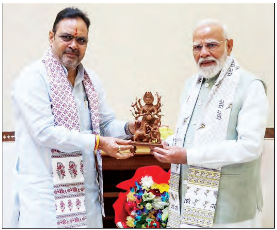
राजस्थान के मुख्यमंत्री भजनलाल शर्मा ने प्रधानमंत्री नरेंद्र मोदी से की शिष्टाचार भेंट।

नई दिल्ली: सुप्रीम कोर्ट ने बुधवार को कहा कि भूमि अधिग्रहण मामलों में उचित मुआवजे की सांविधानिक गारंटी को कम नहीं किया जा सकता। अदालत ने स्पष्ट किया कि क्षतिपूर्ति और ब्याज वित्तीय बोझ की मात्रा पर निर्भर नहीं हो सकते। शीप अदालत ने नेशनल हाईवे अथॉरिटी ऑफ इंडिया (एनएचआई) की समीक्षा याचिका खारिज कर दी। एनएचआई ने 4 फरवरी, 2025 के फैसले की समीक्षा मांगी थी। इस फैसले में कहा गया था कि 2019 का निर्णय पूर्वव्यापी रूप से लागू होगा। 2019 के फैसले में एनएचआई अधिनियम के तहत अधिग्रहित भूमि के किसानों को मुआवजा और ब्याज देने की बात थी। भूस्वामियों को देय ब्याज भूमि अधिग्रहण अधिनियम के अनुसार नौ फीसदी होगा। यह एनएचआई अधिनियम के पांच फीसदी की सीमा के अनुसार नहीं होगा।