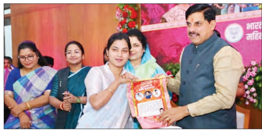
शब्दों में पिरोया है। प्रधानमंत्री नरेन्द्र मोदी के नेतृत्व में राज्य

टीम एक्शन इंडिया भोपाल: मध्य प्रदेश के मुख्यमंत्री डॉ. मोहन यादव ने बुधवार को अपने जन्म दिवस पर बहनों की पाती-भैया के नाम लेकर भोपाल स्थित मुख्यमंत्री निवास पहुंची बहनों का स्वागत किया। मुख्यमंत्री डॉ. यादव ने कहा कि अभिव्यक्ति बहनों की पाती-भैया के नाम एक आत्मीय पहलू है। बहनों का आशीर्वाद हमें निरंतर प्राप्त होता रहा है। मुख्यमंत्री डॉ. यादव ने कहा कि प्रदेश की बहनों ने अपने मन के भाव, अनुभव और सुझाव पाती के माध्यम से व्यक्त किए हैं। बहनों ने अपने भैया के प्रति विश्वास, स्नेह और सम्मान को