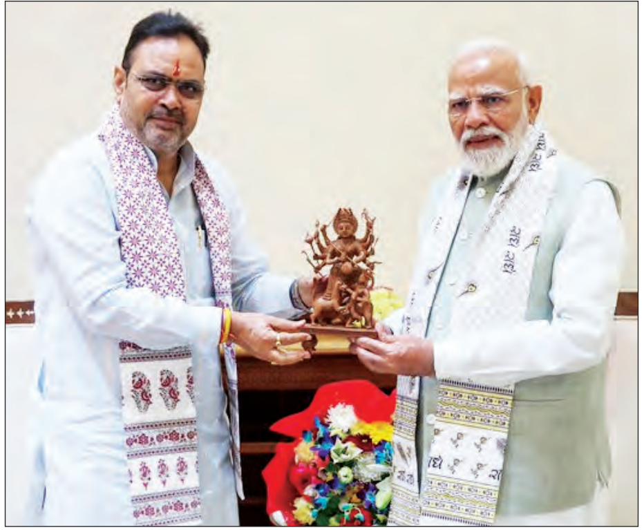
राजस्थान के मुख्यमंत्री भजनलाल शर्मा ने प्रधानमंत्री नरेंद्र मोदी से की शिष्टाचार भेंट।

नई दिल्ली: सुप्रीम कोर्ट ने बुधवार को कहा कि भूमि अधिग्रहण मामलों में उचित मुआवजे की सांविधानिक गारंटी को कम नहीं किया जा सकता। अदालत ने स्पष्ट किया कि क्षतिपूर्ति और ब्याज वित्तीय बोझ की मात्रा पर निर्भर नहीं हो सकते। शीर्ष अदालत ने नेशनल हाइवे अथॉरिटी ऑफ इंडिया (एनएचआई) की समीक्षा याचिका खारिज कर दी। एनएचआई ने 4 फरवरी, 2025 के फैसले की समीक्षा मांगी थी। इस फैसले में कहा गया था कि 2019 का निर्णय पूर्वव्यापी रूप से लागू होगा। 2019 के फैसले में एनएचआई अधिनियम के तहत अधिग्रहित भूमि के किसानों को मुआवजा और ब्याज देने की बात थी। भूस्वामियों को देय ब्याज भूमि अधिग्रहण अधिनियम के अनुसार नौ फीसदी होगा। यह एनएचआई अधिनियम के पांच फीसदी की सीमा के अनुसार नहीं होगा।