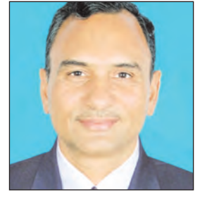
युवाओं ने नरवाना में शहीदी दिवस पर इनेलो के प्रति जो भरोसा जताया