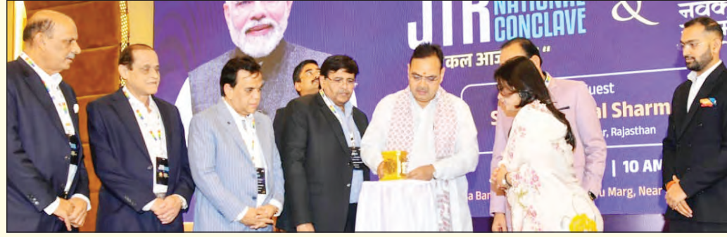
को आगे बढ़ाया है। अहिंसा, करुणा एवं सत्य के मूल्यों के आधार पर भारतीय सभ्यता के निर्माण में अतुलनीय योगदान दिया है। उन्होंने कहा कि भगवान महावीर स्वामी की अहिंसा की शिक्षा और प्राचीन काल से चली आ रही ज्ञान परंपरा के

ऑगनाइजेशन (जीटो) टाउन रिजल्टेंटिव नेशनल कॉन्क्लेव एवं विश्व नवकार महामंत्र दिवस 2.0 कार्यक्रम को संबोधित कर रहे थे। उन्होंने कहा कि मूल्य आधारित नेतृत्व, सामाजिक एकता एवं आध्यात्मिक चेतना भारत के उज्वल भविष्य की नींव है। हमें अपने निर्णयों में ईमानदारी, पारदर्शिता, जनसेवा एवं नैतिकता को प्राथमिकता देनी चाहिए। साथ ही, एक-दूसरे के प्रति संवेदनशील होकर कर्तव्यबोध को सर्वोपरि रखना चाहिए। मुख्यमंत्री ने कहा कि जैन समाज ने सदियों से भारतीय सभ्यता एवं संस्कृति